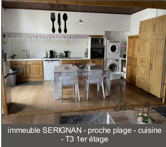
immeuble SERIGNAN - proche plage - cuisine - T3 1er étage